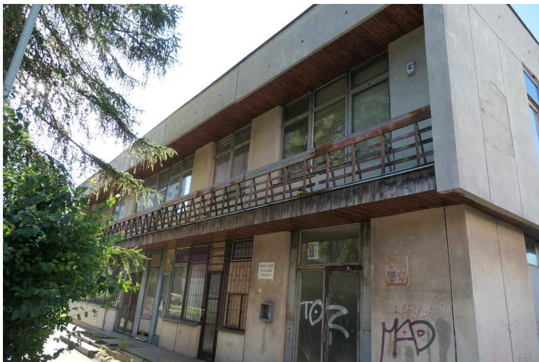
Pohled z vchodové strany